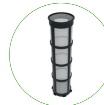
Filterkerze für die Varianten pureliQ:K und KD